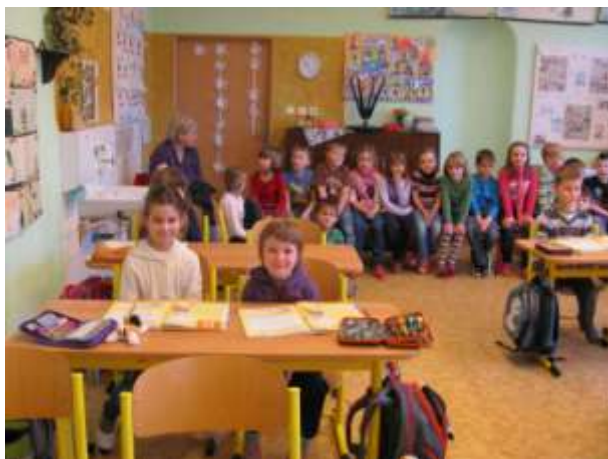
Předškoláci v 1. třídě